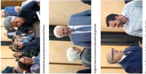
Antonella Bundu (a sinistra) con il sindaco del Tirreno Eugenio Gianni

64 anni, 1961 - Livorno. Ex sindaco di Pisa, ex ministro della Giustizia, candidato alle elezioni regionali per Firenze-Rovina